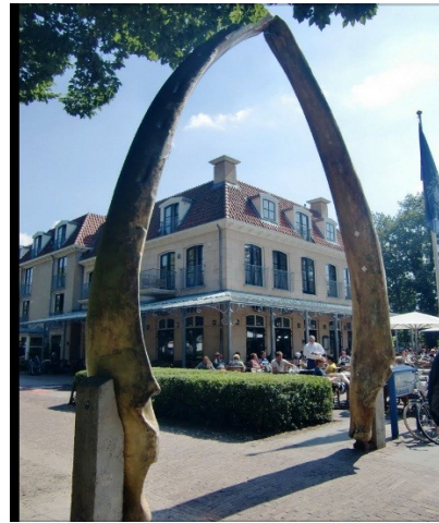
Afbeelding 3: It Aude Beuthus detail