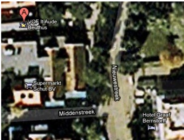
Afbeelding 4: It Aude Beuthus kaart