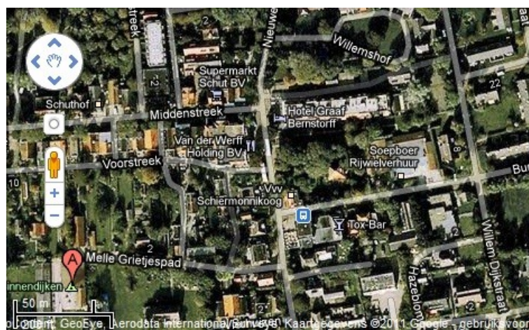
Afbeelding 2: stadskern

AFB 2: Duid op bovenstaande kaart de 5 benoemde locaties aan die in het verhaal voorkomen. Een ervan is aangeduid met A. Geef ook de route aan die de personages afgelegd hebben.