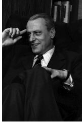
Willem Frederik Hermans